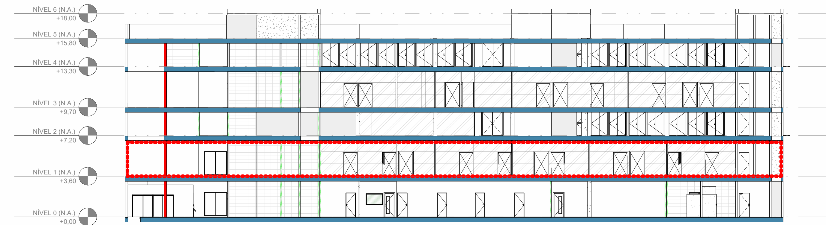
2 CORTE - LOCALIZAÇÃO NO PAVIMENTO - N1 ESCALA 1: 200